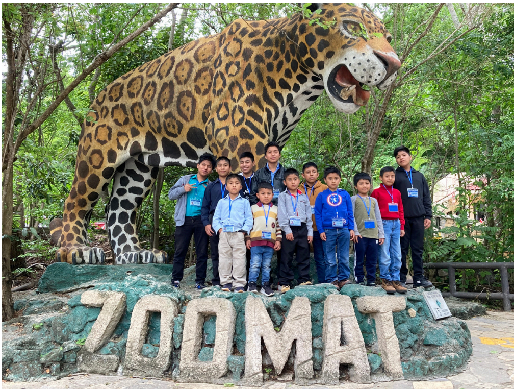
FOTO GRUPAL DE SALIDA RECREATIVA AL ZOOLOGICO (ZOOMAT) EN JUNIO DEL 2025

Gracias a todos ellos nuestros estudiantes de AECH A.C. han podido contar con una alimentación balanceada, una buena salud y educación integral