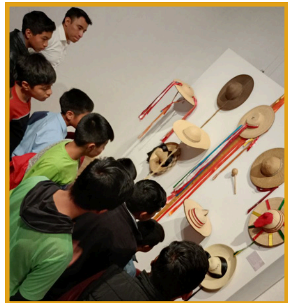
FOTO DE SALIDA GRUPAL AL MUSEO DE TEXTILES DEL MUNDO MAYA