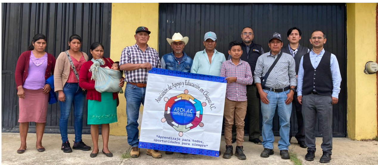
FOTO GRUPAL CON EL CONSEJO DE LA COMUNIDAD DE SANTO TÓMAS

Seguiremos trabajando con compromiso, transparencia y vocación, convencidos de que invertir en educación es invertir en un mejor futuro para Chiapas.