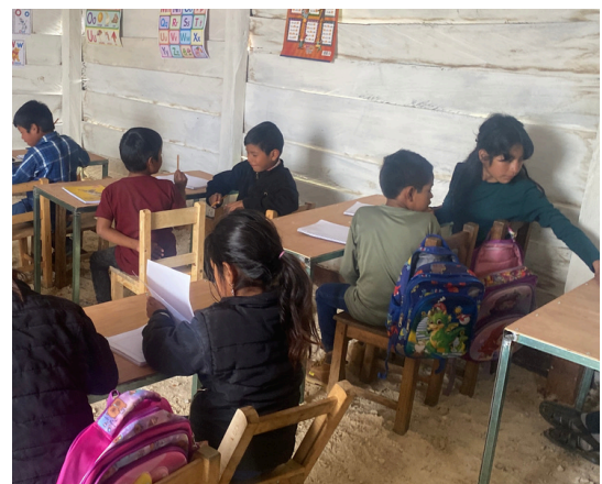
FOTOS DE LAS CLASES DIARIAS DEL PROYECTO EDUCATIVO "EDUCACION SIN BARRERAS"