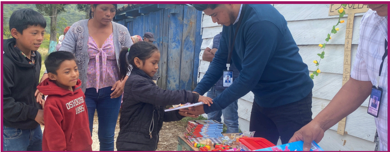
FOTO DE ENTREGA DE ÚTILES ESCOLARES EN LA INAUGURACIÓN DEL PROYECTO EDUCATIVO “EDUCACIÓN SIN BARRERAS”

AECH A.C. responde a esta realidad mediante programas educativos flexibles e integrales, diseñados para acompañar a las y los estudiantes de acuerdo con su contexto, edad y nivel académico, priorizando la permanencia escolar y el aprendizaje significativo.