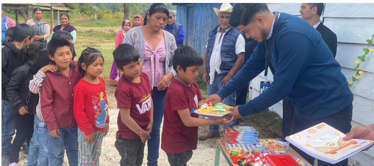
FOTO DE ENTREGA DE UTILES ESCOLARES PARA ESTUDIANTES DEL PROYECTO "EDUCACIÓN SIN BARRERAS"