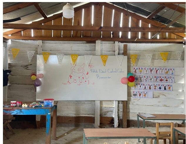
FOTO DE REMODELACIÓN DE AULA ESCOLAR PARA LA COMUNIDAD DE SANTO TÓMAS