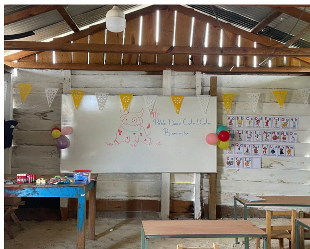
"Este es el antes y el después de la nueva aula".